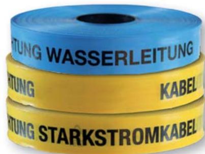
(Trassenwarnbänder, diverse Typen)

Trassenwarnbänder (0,15 mm stark) aus PEw nach FTZ-Norm 548 TV1 Länge: 250 Meter / Breite: 40 mm